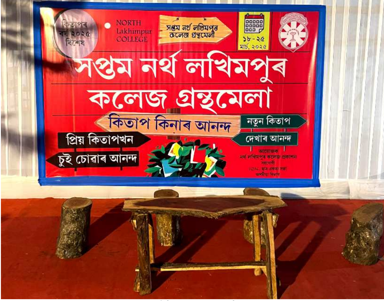
সপ্তম নৰ্থ লখিমপুৰ কলেজ গ্ৰন্থমেলাৰ মুকলি মঞ্চ

একাদশ বছৰ, প্ৰথম সংখ্যা, ২৪ এপ্ৰিল, ২০২৫, বৃহস্পতিবাৰ, মূল্য : ৩০.০০