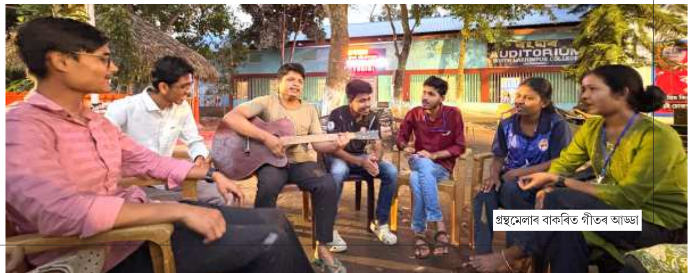
গ্ৰন্থমেলাৰ বাকৰিত গীতৰ আড্ডা

নৰ্থ লখিমপুৰ কলেজে গ্ৰন্থমেলা আৰু সাহিত্য উৎসৱ আয়োজন আৰু সেই গ্ৰন্থমেলাত ভিন ভিন ব্যতিক্ৰমী কাৰ্যসূচী অনুষ্ঠিত কৰি ৰাজ্যখনৰ বৌদ্ধিক বিপ্লৱক গতিশীলতা প্ৰদান কৰাৰ ক্ষেত্ৰত আৰু মানৱ সম্পদ গঢ়াৰ ক্ষেত্ৰত যি প্ৰচেষ্টা অব্যাহত ৰাখিছে— সেই প্ৰচেষ্টা দীৰ্ঘস্থায়ী আৰু যুগমীয়া হওক। সেই আশা পোষণ কৰি কলেজ কৰ্তৃপক্ষ, পৰিয়ালবৰ্গলৈ আমি আন্তৰিক শুভেচ্ছা জ্ঞাপন কৰিছোঁ। “We need that EDUCATION by which character is formed, intellect is expanded, strength of mind is increased and by which one can stand on one’s own feet” - Swami Vivekananda.”